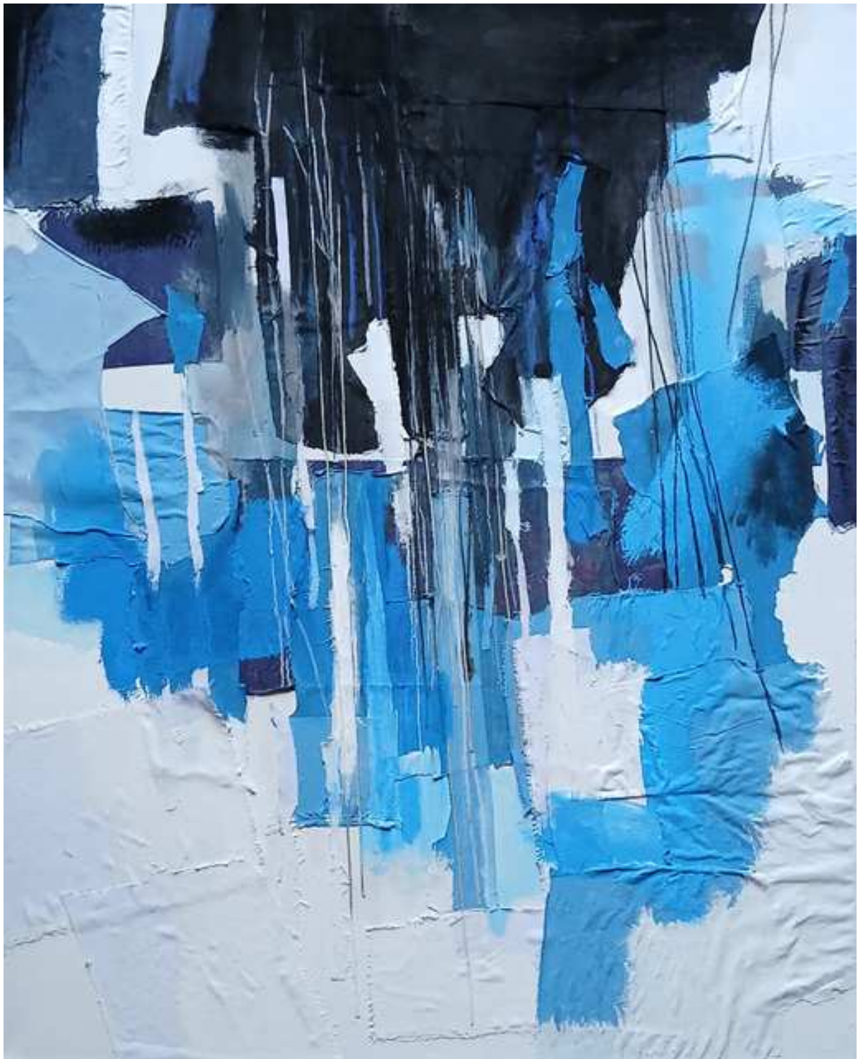
CORDES D'AIGUA (2025)

Pintura acrílica, tela de algodón, hilo de algodón, lápiz pastel 80 cm. x 100 cm. 645 €