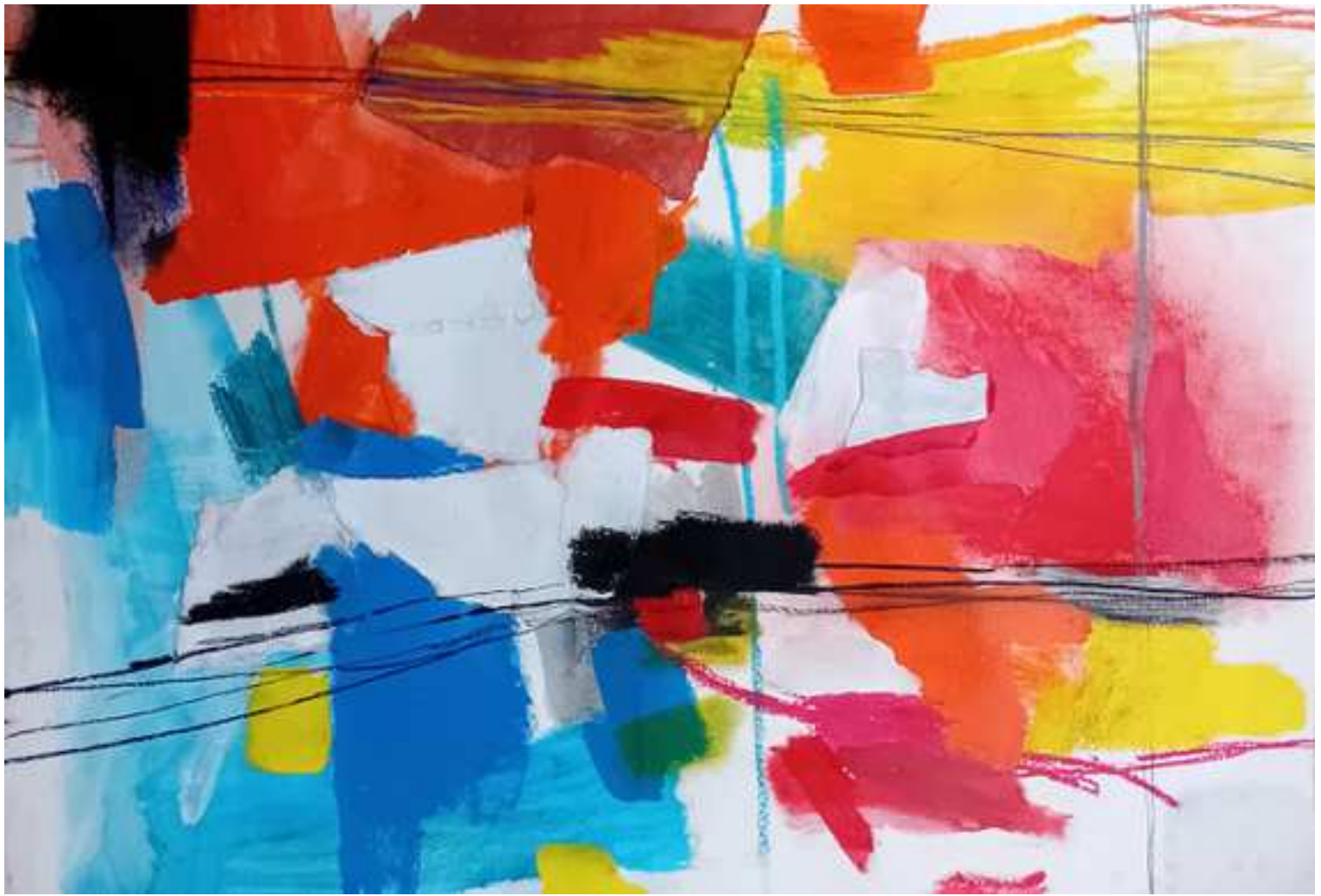
ORDEN RECTA (2024) Técnica mixta sobre papel de algodón. 50 cm. x 70 cm. 385 €