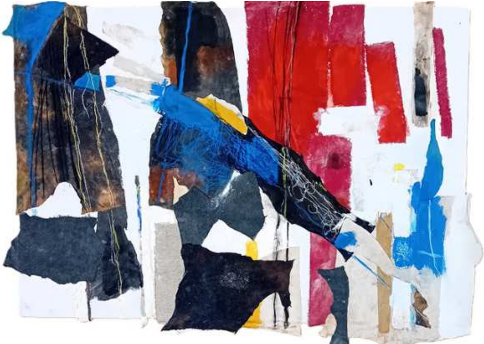
ORDEN PREPARADO (2024)

Técnica mixta. Pintura acrílica, tela y pastel sobre papel de algodón. 80 cm. x 100cm. 585 €