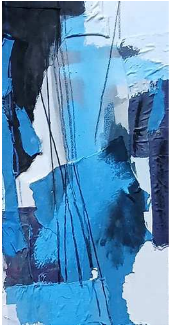
CORDES D'AIGUA (2025) Detalles