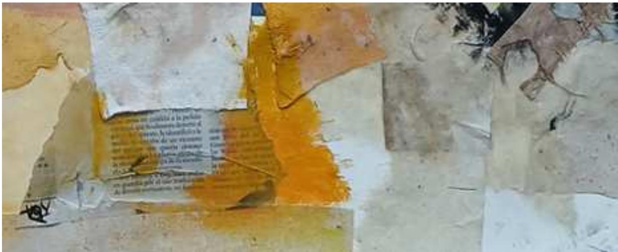
DIAGONAL (2018) Detalles