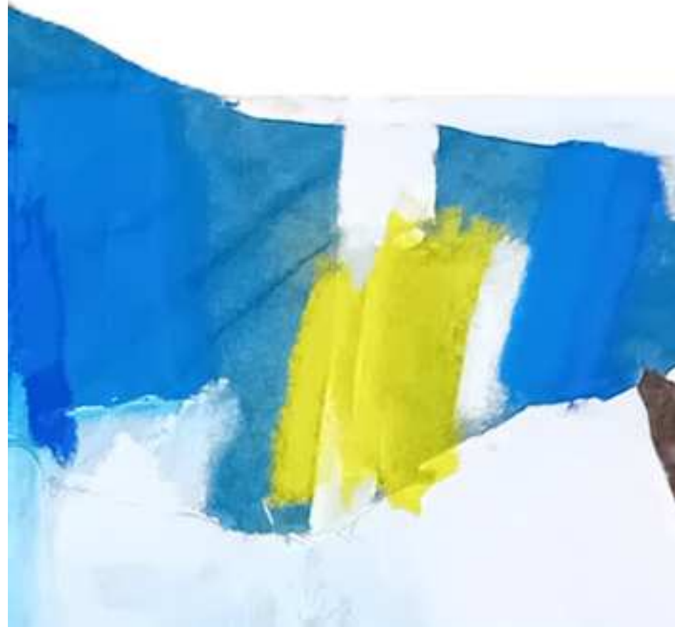
ORDEN NARANJA (2024) Detalles