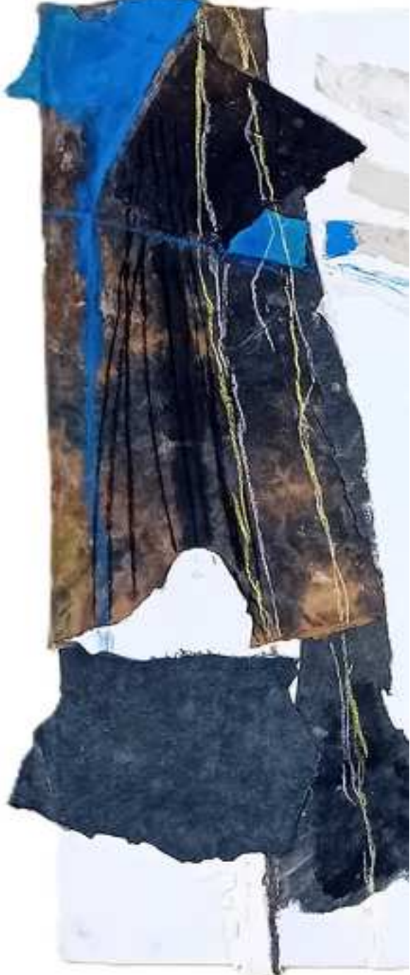
ORDEN PREPARADO (2024) Detalles