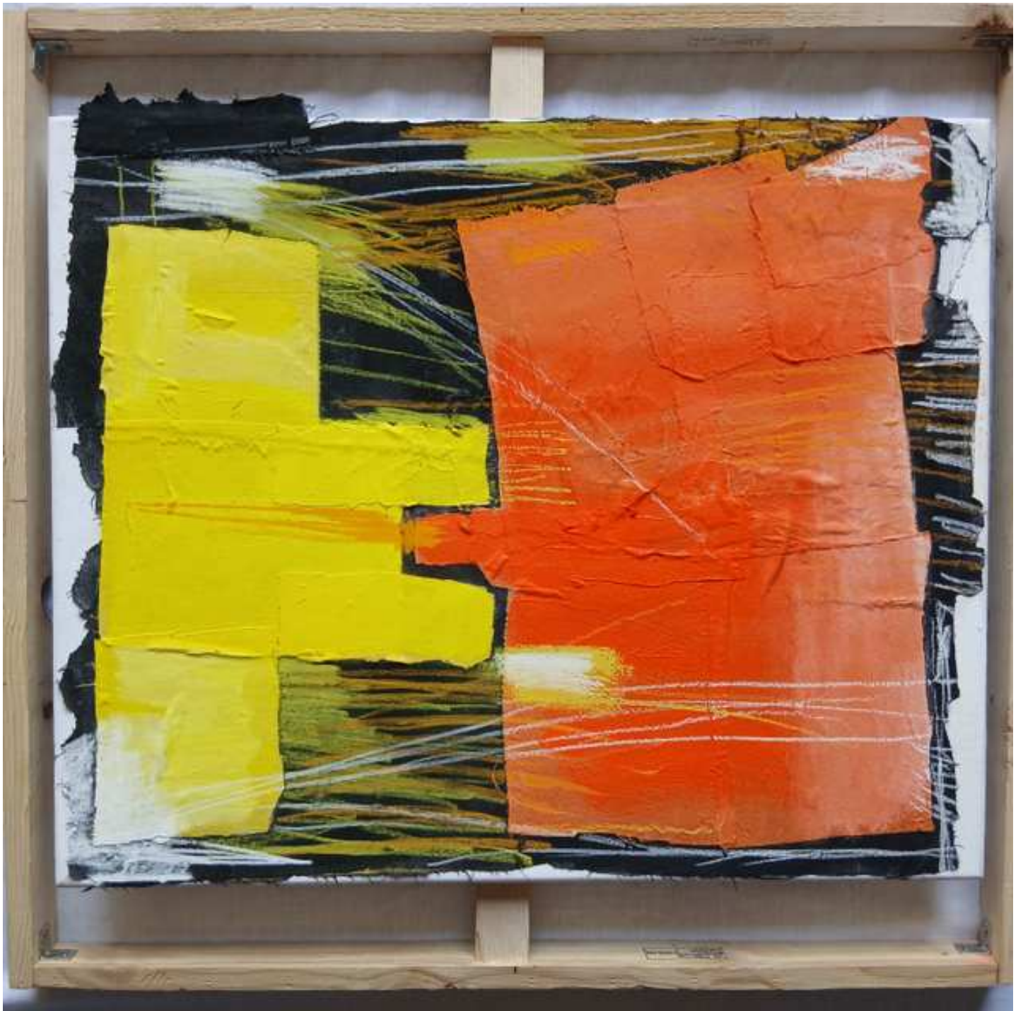
ESCENA DE CAZA (2025) Pintura acrílica, tela de algodón, lápiz pastel sobre soporte de madera. 70 cm. x 65 cm. x 10 cm. 425 € (Marco incluido)

Flechas lanzadas se clavan sobre cuerpos y sombras...tú que has lanzado dardos y clavado espadas... ¿Te sientes o te has sentido acorralada? ¿Te sientes acosado? ¿Redes y cuerdas para atrapar y dominar...hay figuras que están siendo abordadas la lucha es feroz...quién vencerá? ¿Oscureces y ensombreces, te han rodeado y enjaulado...te han destruido? Robas energías... perdiste el alma.. Devorados, engullidas...eres tú la captura?