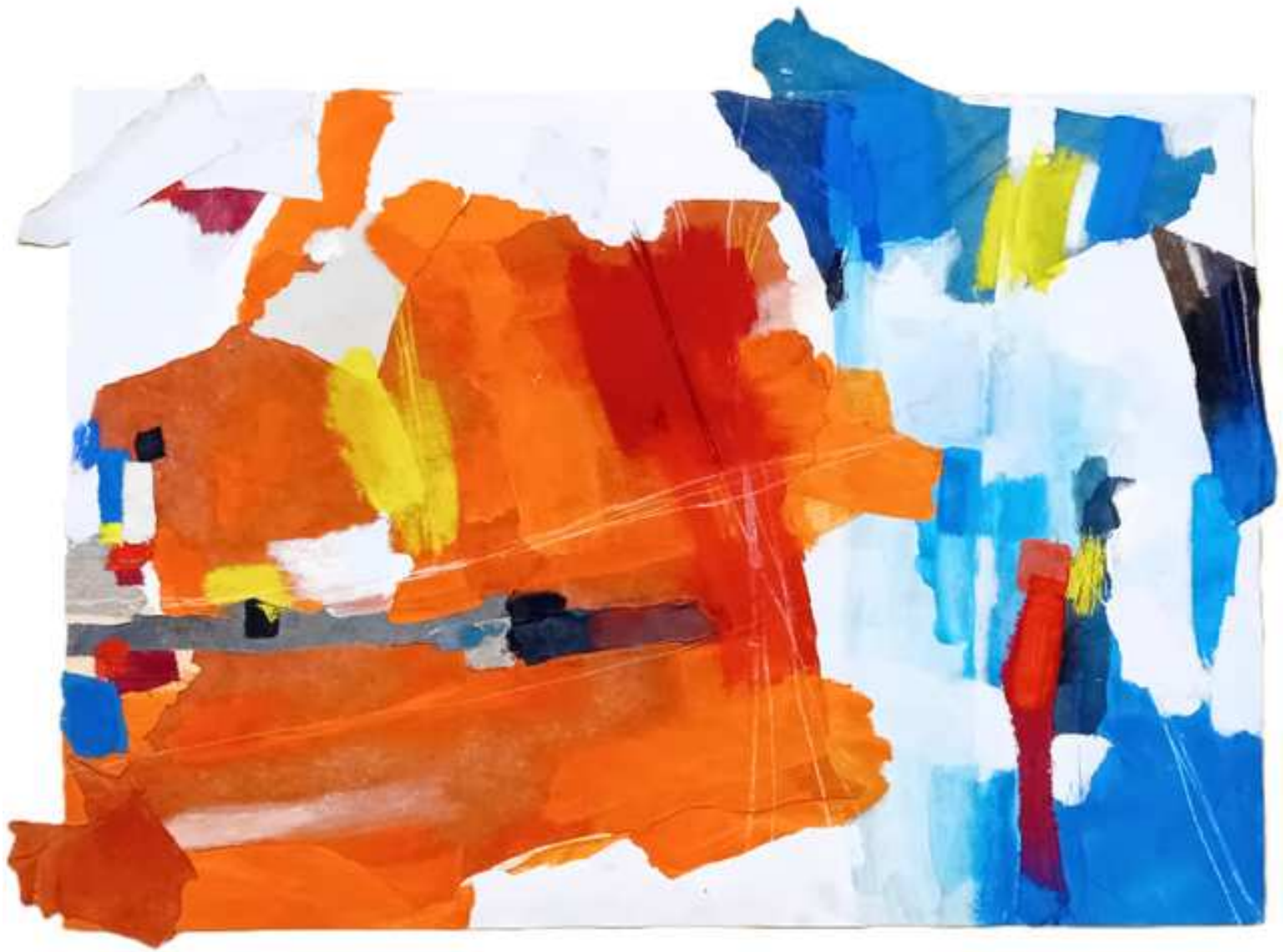
ORDEN NARANJA (2024) Técnica mixta. Pintura acrílica, tela y pastel sobre papel de algodón. 80 cm. x 100cm. 585 €