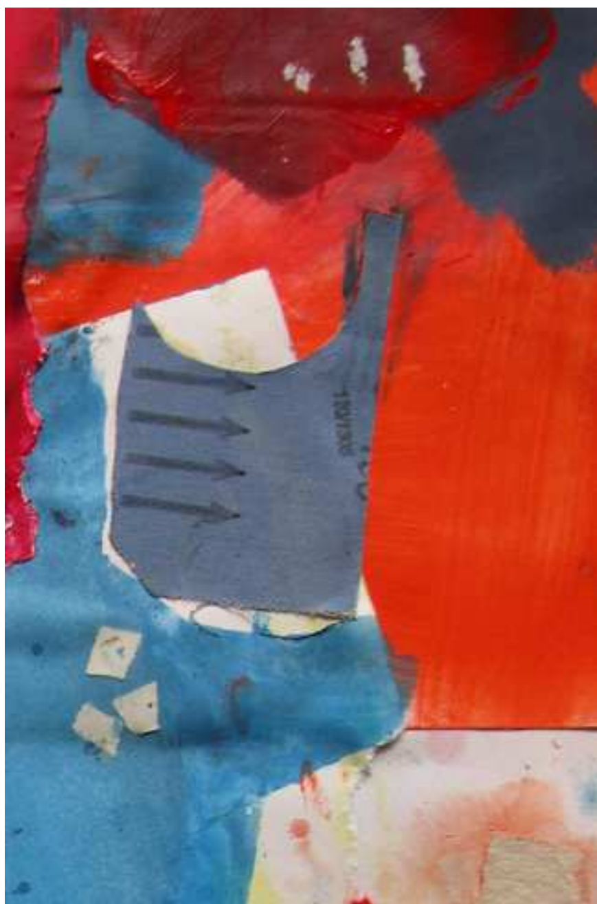
TAMANYS I (2018) Detalles