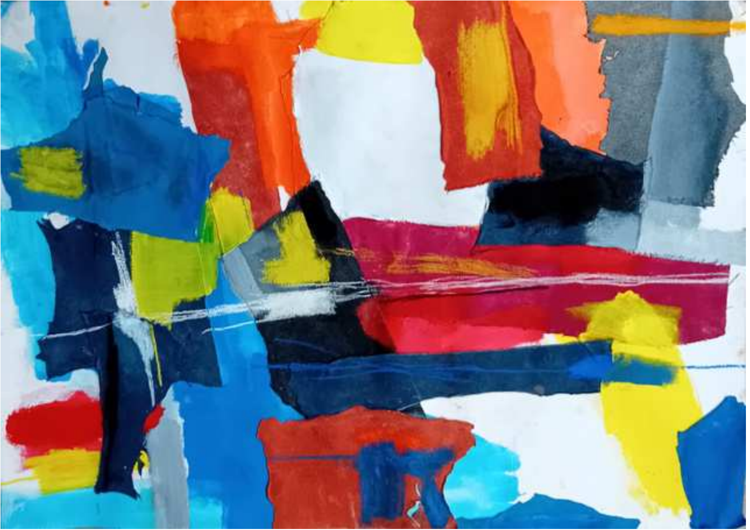
ATRACCIÓN ORDENADA (2024) Técnica mixta sobre papel de algodón. 50 x 70 cm. 385 €