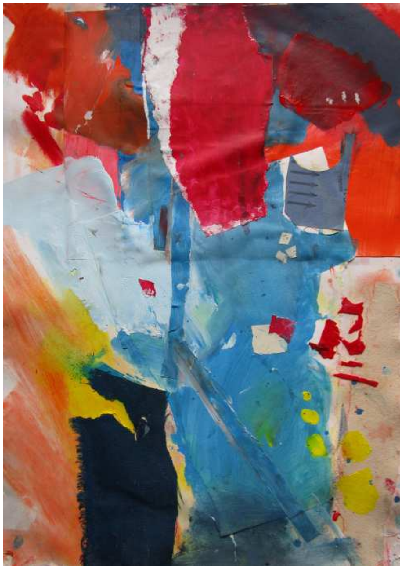
TAMANYS I (2018) Pintura acrílica, tela de algodón, papel. sobre papel de algodón. 70 cm. x 50 cm. 385 €