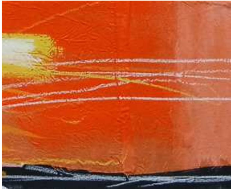
ESCENA DE CAZA (2025) Detalles